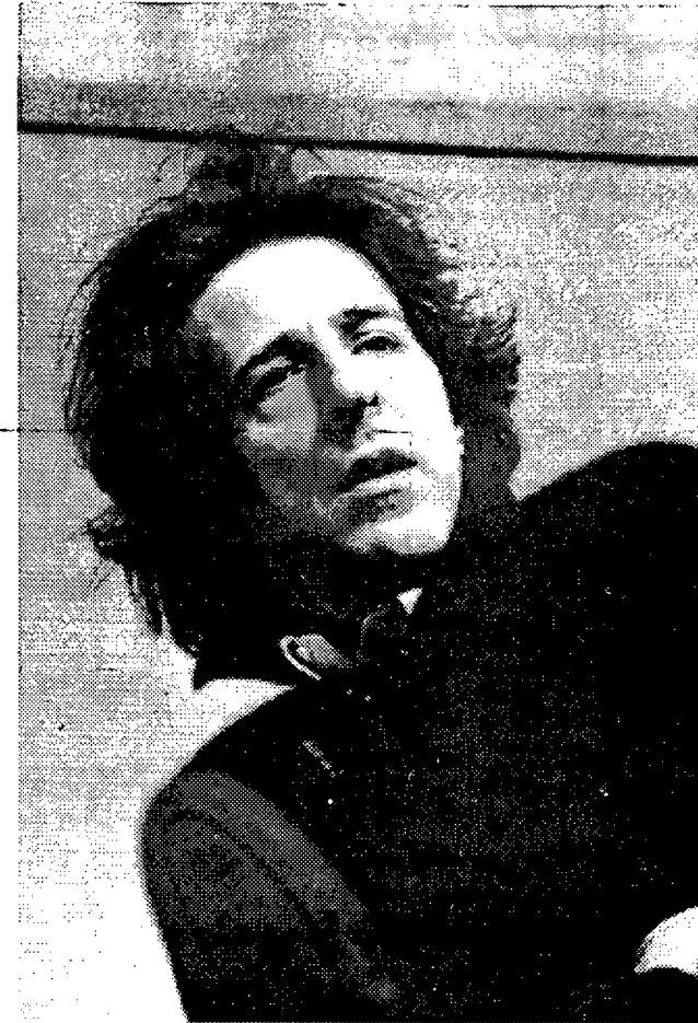
Tre immagini di epoche diverse di Giorgio Gaber (in alto a sinistra con la moglie Ombretta Colli). Il celebre cantante e autore, che fino a domani sera è in scena al Manzoni di Pistoia con il suo spettacolo, parla del suo rapporto con la Versilia e la Lucchesia dove possiede una villa

nessuno, che guardi con affetto, ma senza nessuna vena mondana.